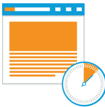
Высокая готовность и распределение нагрузки