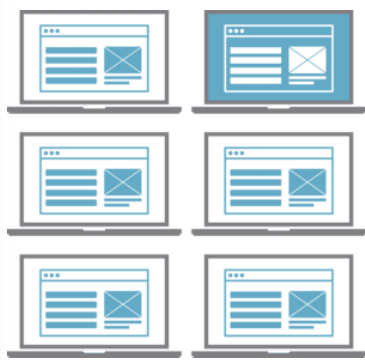
Доставка рабочих столов VDI